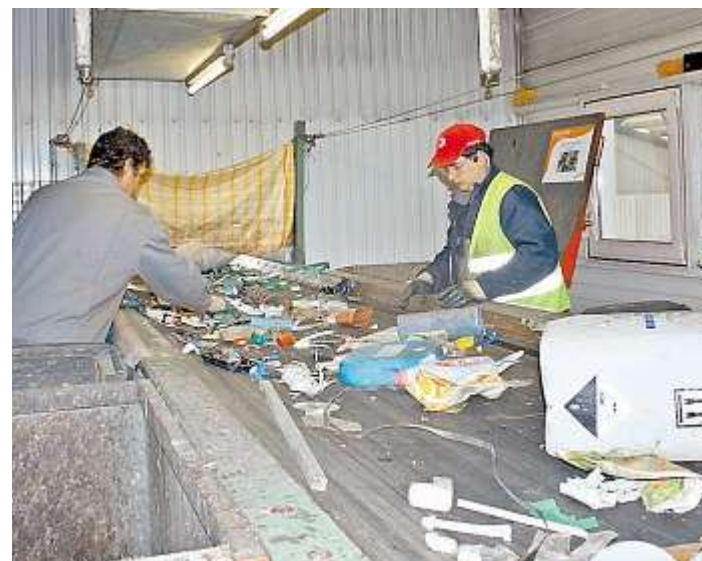
Sechs Vollzeit- und sechs Halbezeitstellen für ein halbes Jahr bietet das sozialökonomische Projekt „Umweltwerkstatt“ in Lienz.